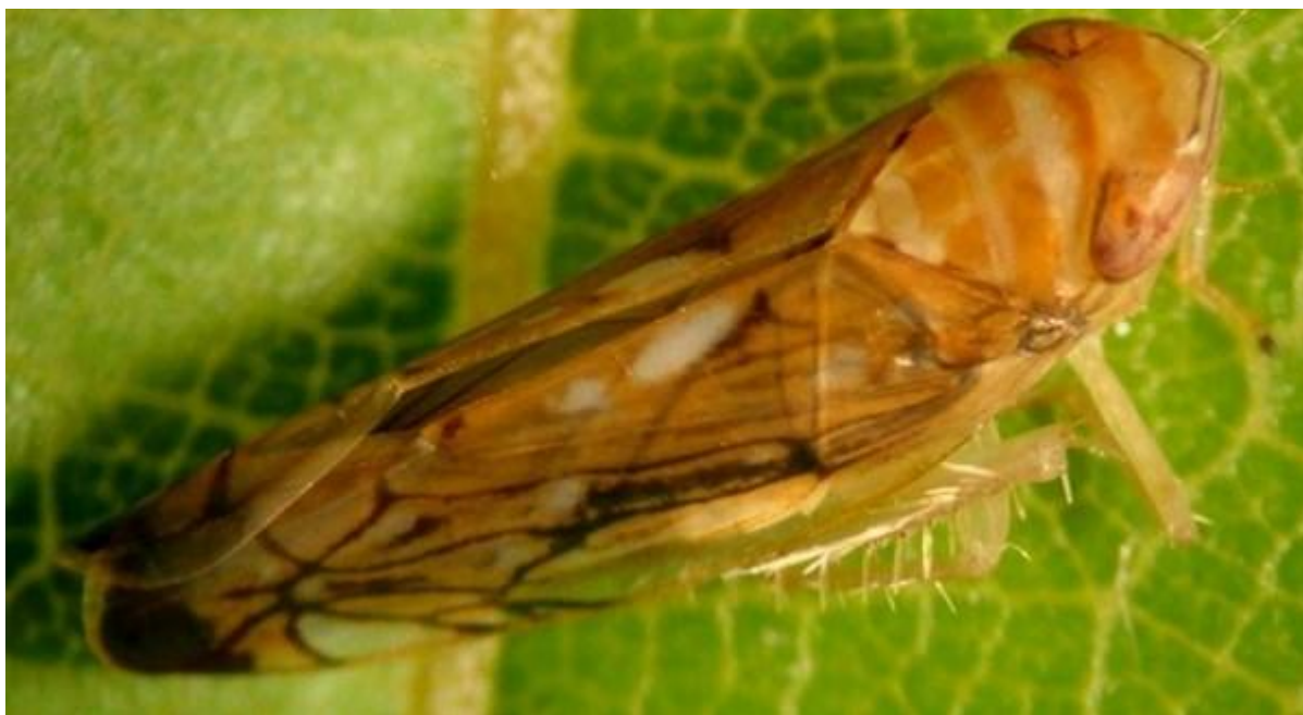
Slika 2. Odrasli oblik američkog cvrčka